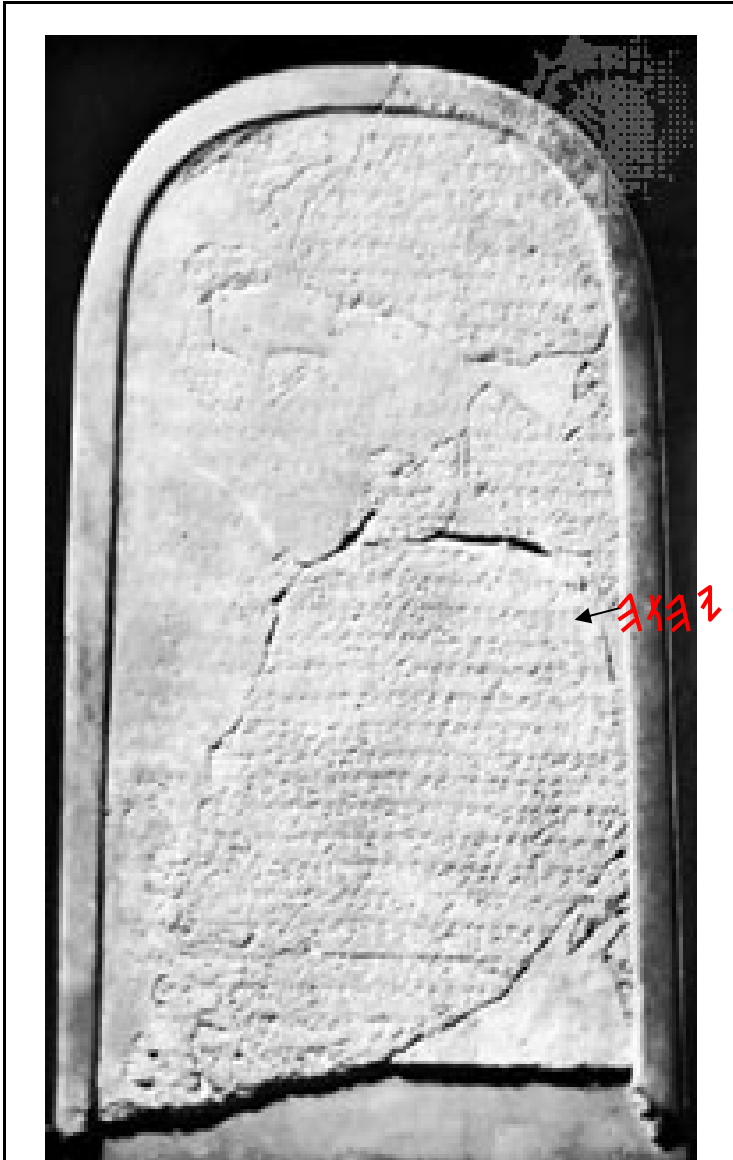
PIEDRA MOABITA: Ésta piedra grabada describe una victoria del noveno siglo A.C. por el Rey Moabita Mesa, sobre los Israelitas, escritas en lenguaje Moabita (muy cercano al paleo-Hebreo), la inscripción que incluye el Tetragrammaton en la línea 18 (ver flecha) se lee: “Yo por lo tanto, tomé los altares de la casa de Yahweh, y los llevé delante de Kamosh”

representado por “Señor” y “Theós” fue reemplazado por “Dios” en los textos ingleses y españoles; estas designaciones como quiera, nunca debieron haber sido usadas como